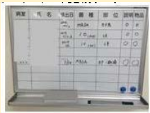
スタッフステーション