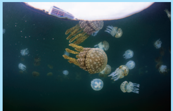
長水路はタコクラゲを身近に観察できる貴重な場所。

すぐに私の目の前に、脈動しながら泳ぐタコクラゲが現れました。透明度が低い、限られた視界の中に、次々に茶色や白のたくさんのタコクラゲたちが現れては消えて行きます。水面越しのビルを背景に、タコクラゲたちが泳ぐ姿は、市街地の目の前でありながら、どこか非現実な光景で、私は時間を忘れて魅せられていました。