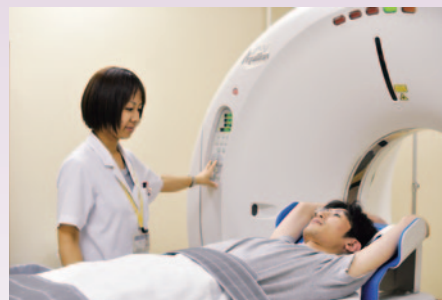
最新型のCT(TOSHIBA Aquilion CXI)を操作する

高校生の頃からコ・メディカル(医師・看護師以外の医療従事者のこと)の仕事に興味がありました。自分の性格なども考えて、裏方としてお手伝いをするような職種がいいと考え、診療放射線技師の勉強ができる医療技術短大へ進学しました。学生時代の3年間は朝から夕方まで講義で大変でしたが、勉強に集中することができ、充実した時間を送れたと思います。