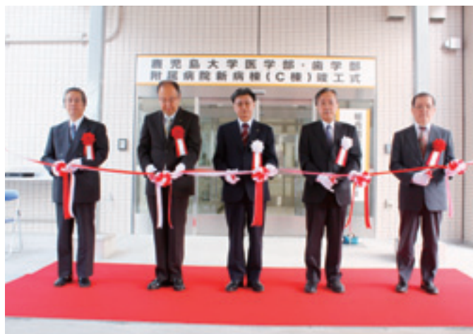
テープカットの様子

新病棟は、地上9階建(延べ床面積15,437㎡)の免震構造で、294床を擁し、既存病棟より病床、スタッフステーションなどの床面積を拡充した開放的な造りとなっており、個室の増床、各個室・4床室へのトイレ設置など患者さんの居住環境も大きく改善されています。屋上には県ドクターヘリの受入、患者搬送時間短縮などに貢献するヘリポートが整備されています。