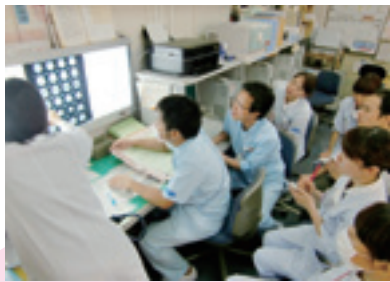
医師・看護師・合同での治療方針についての検討会

また、脳卒中リハビリテーション看護認定看護師と摂食・嚥下障害看護認定看護師がおり、指導・相談を通して、専門性の高い看護を提供できるように努めています。