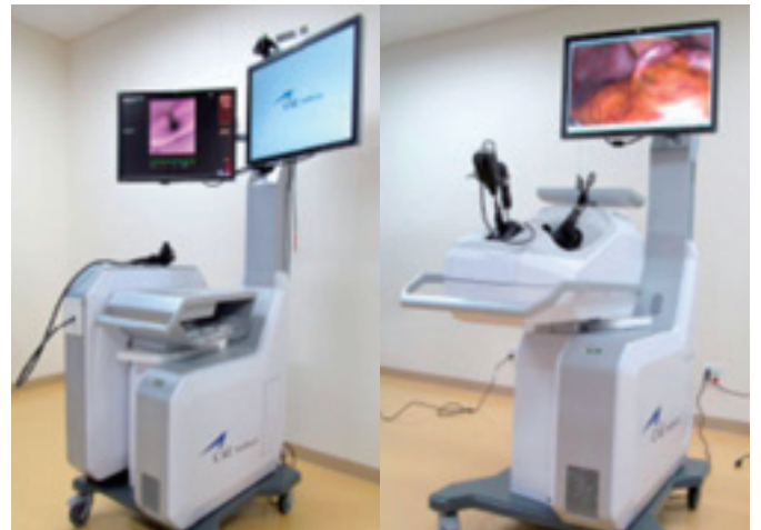
各種シミュレータ(総合臨床研修センター)