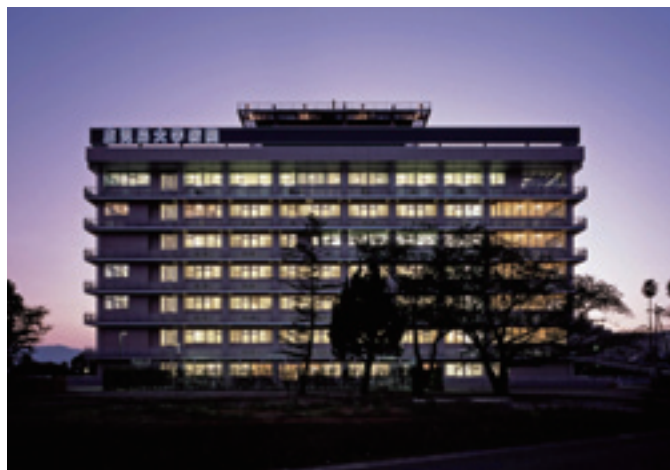
夜の景観 新病棟東面