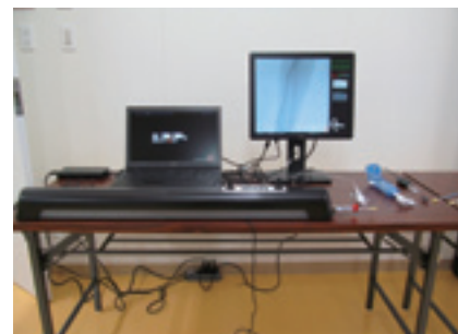
血管造影シミュレータ