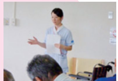
家族を対象にした介護の勉強会