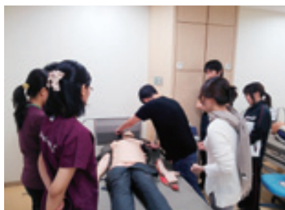
救急蘇生シミュレーション風景