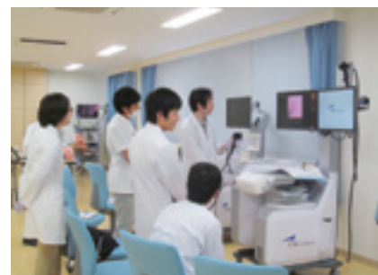
内視鏡シミュレーション風景