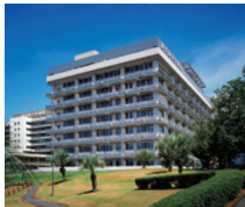
総合臨床研修センター

本センターは、卒後初期研修医だけではなく、県内全ての医療関係者への生涯教育の場を提供することで、鹿児島県における地域医療に貢献したいと考えています。これからの鹿児島を担う医療人の育成を目指します。