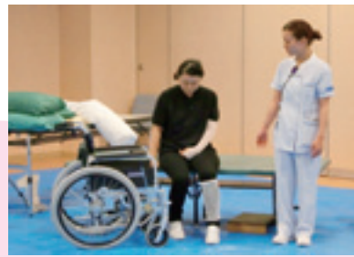
公開講座:麻痺のある人のベッドから車いすへの移乗についての実践演習