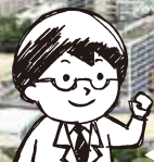
鹿児島大学病院長