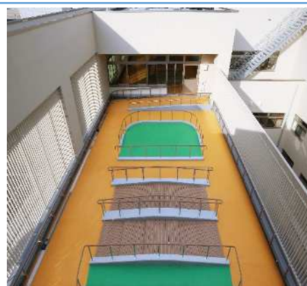
屋外リハビリテーション施設