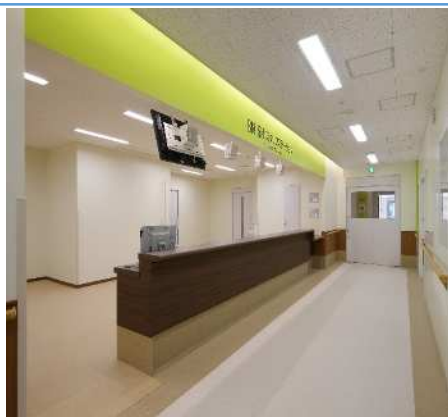
スタッフステーション