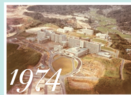
1974 鹿児島市宇宿町 (現在の桜ヶ丘)に移転 (昭和49年)