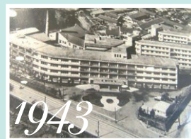
1943 前身の県立鹿児島医学 専門学校附属病院 (鹿児島市山下町、現在の城山町) (昭和18年)

内視鏡検査室を5室、透視検査室2室を完備し、低侵襲治療の機能を強化しました。チーム医療を活かした診察室・処置室を機能的に配置し、高度な診療・検査・治療を提供できる医療環境を提供します。