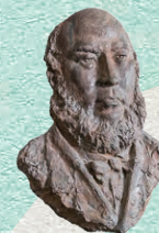
ウィリアム・ウィリス