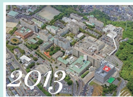
2013 病棟（C棟）稼働開始 (平成25年)