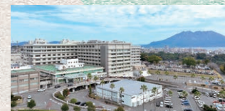
外来診療棟・病棟(A棟)竣工(令和6年1月)