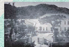
医専病院(昭和18年頃)