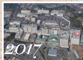
2017 病棟（B棟）稼働開始 (平成29年)