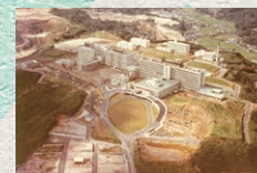
桜ヶ丘に移転(昭和49年)